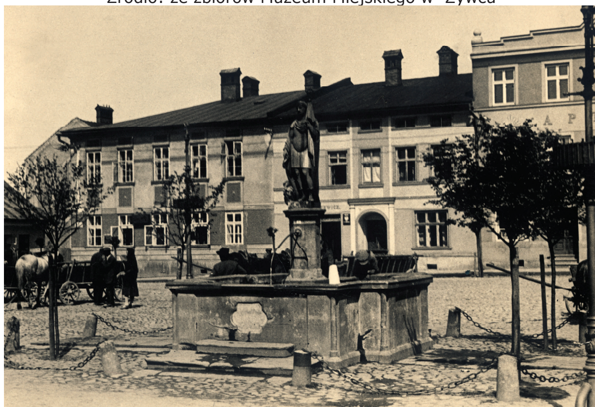
Fot. 3 Studnia Św. Floriana wraz z figurą, najlepiej zachowane zdjęcie.