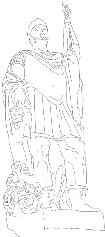
Rys. 3 Rzeźba od frontu