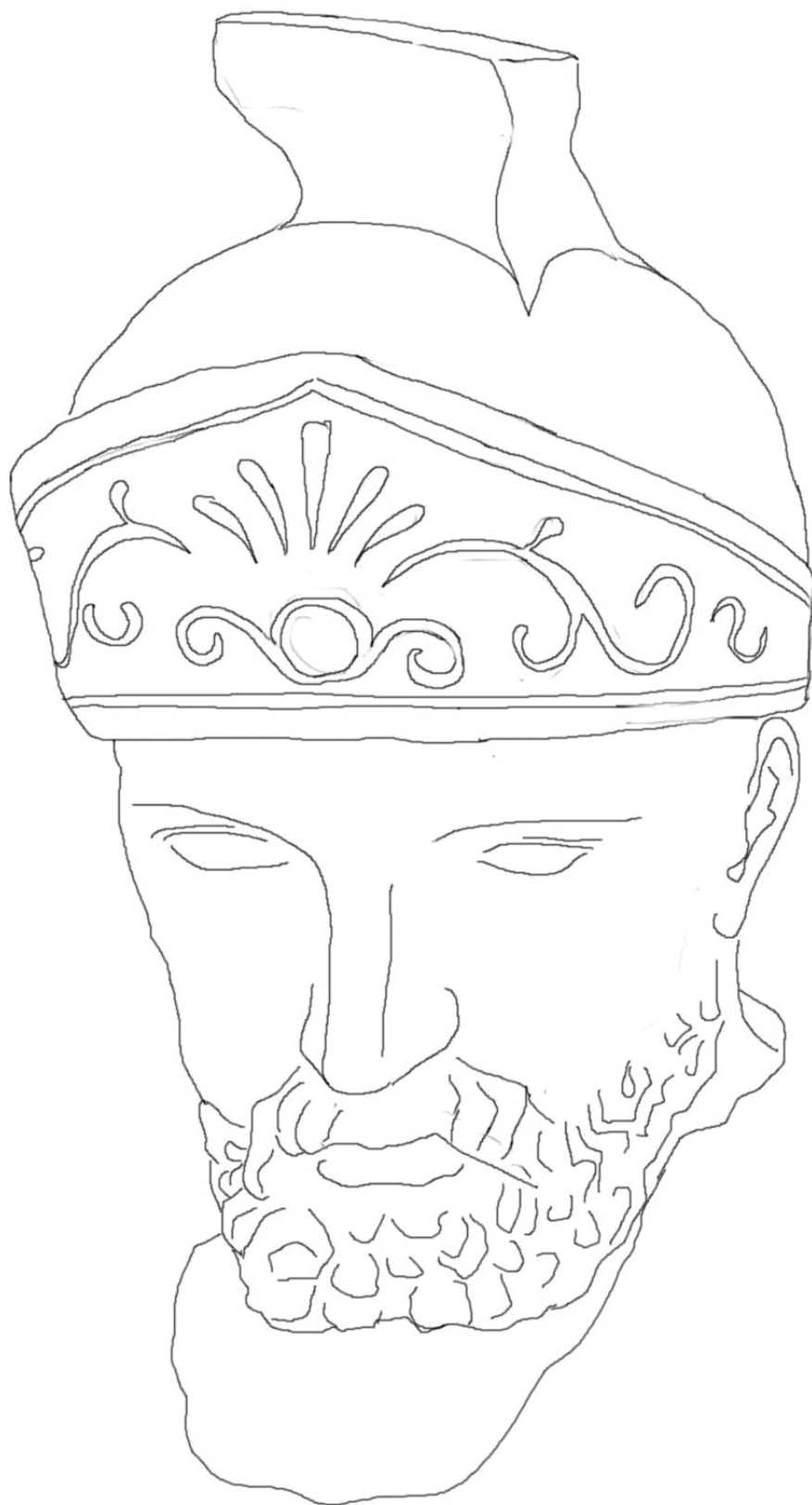
Rys. 1 Rysunek głowy Św. Floriana