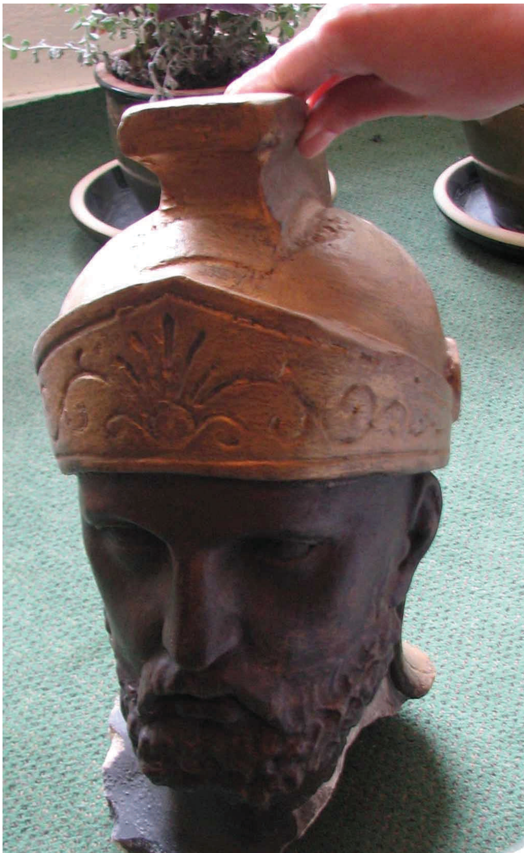
Fot. 5 Oryginalna głowa z figury Św. Florianu, aktualnie znajduje się w zbiorach Muzeum Miejskiego w Żywcu