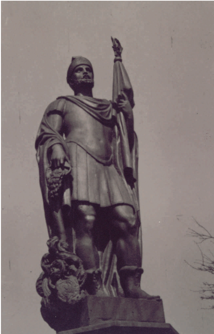
Fot. 4 Figura Św. Floriana Źródło: ze zbiorów Muzeum Miejskiego w Żywcu

Źródło: ze zbiorów Muzeum Miejskiego w Żywcu