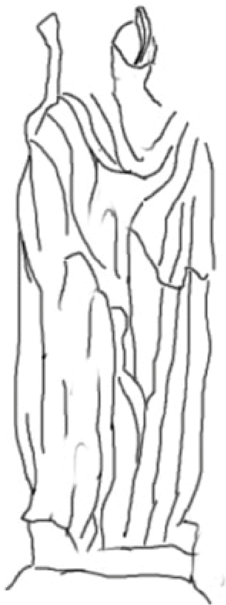
Rys. 2 Rysunek przedstawiający rzeźbę Św. Floriana od tyłu.