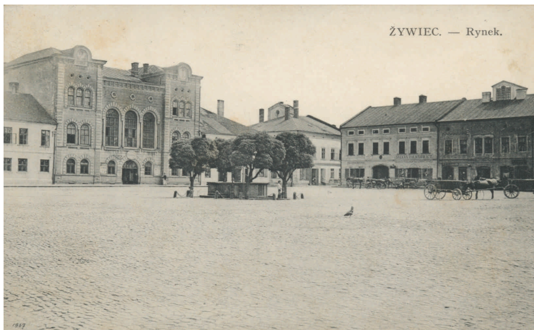
Fot. 2 widok studni Św. Floriana od strony ul. Jagiellońskiej w kierunku Ratusza