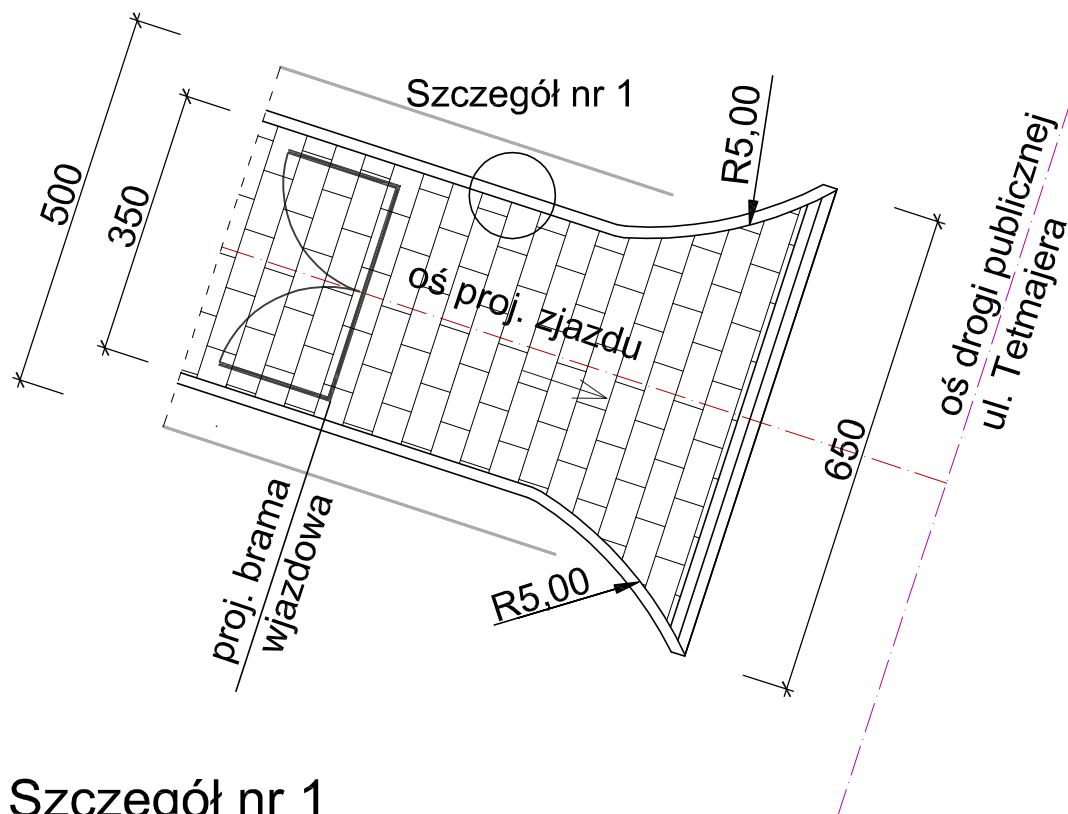
Szczegół nr 1 posadowienie obrzeża skala 1:25