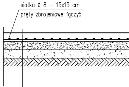
PŁYTA ŻELBETOWA SPOSÓB ZBROJENIA 1:20

POWIERZCHNIA ZATARTA MECHANICZNIE BETON C20/25 ZBROJONY SIATKĄ Z PRĘTÓW \varnothing 8 mm O OCZKACH 15x15 cm HYDROTECHNICZNY W8, MROZOODPORNY F150, gr. 15 cm ZACIERANY NA GŁADKO, ZABEZP. PREPARATEM DO PIELĘGNACJI BETONU WARSTWA Z KRUSZYWA ŁAMANEGO, gr. 25 cm – FRAKCJE 0–31,5 mm STABILIZOWANA MECHANICZNIE WARSTWA Z KRUSZYWA ŁAMANEGO, gr. 25 cm – FRAKCJE 31,5–63,0 mm STABILIZOWANA MECHANICZNIE GRUNT NOŚNY