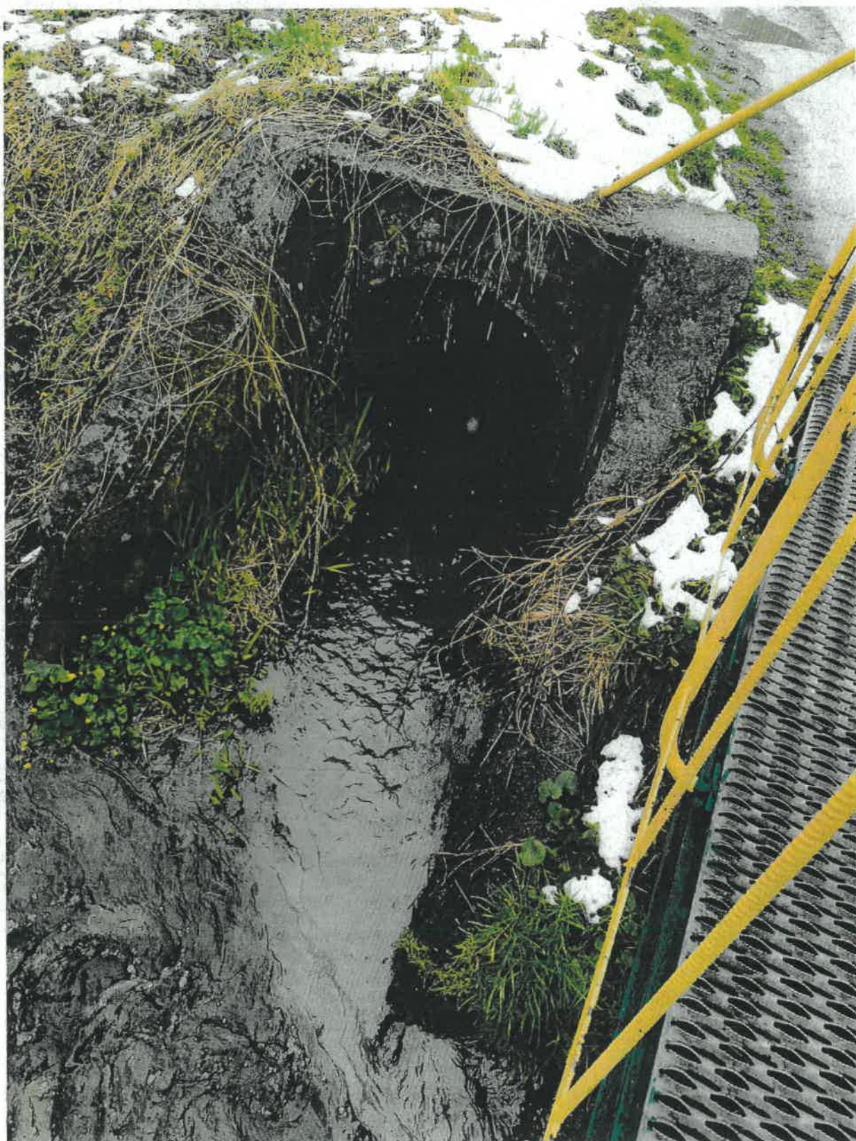
Fot. 3 Wylot do potoku Sienka na wysokości posesji przy ul. Nimasów 33 (posesja naprzeciwko wylotu).