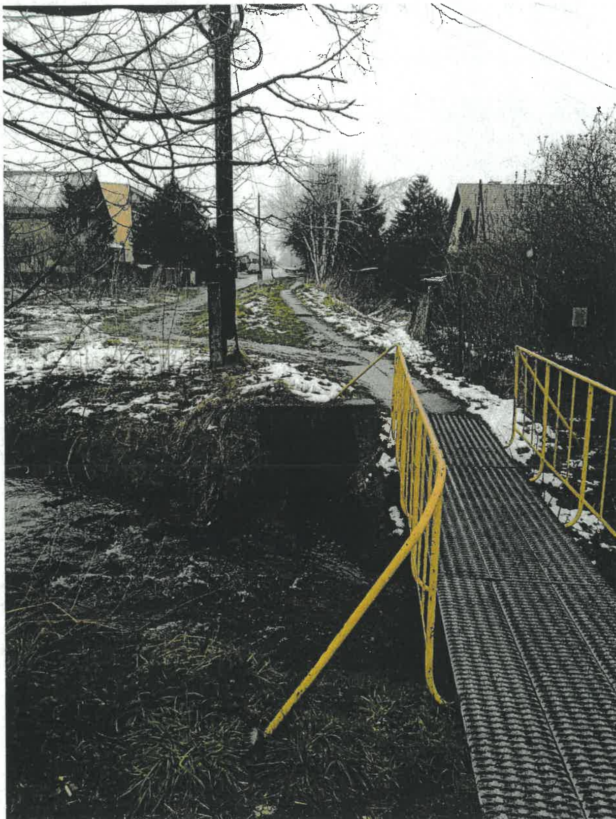
Fot. 1 Wylot do potoku Sienka na wysokości posesji przy ul. Nimasów 33 (posesja naprzeciwko wylotu).