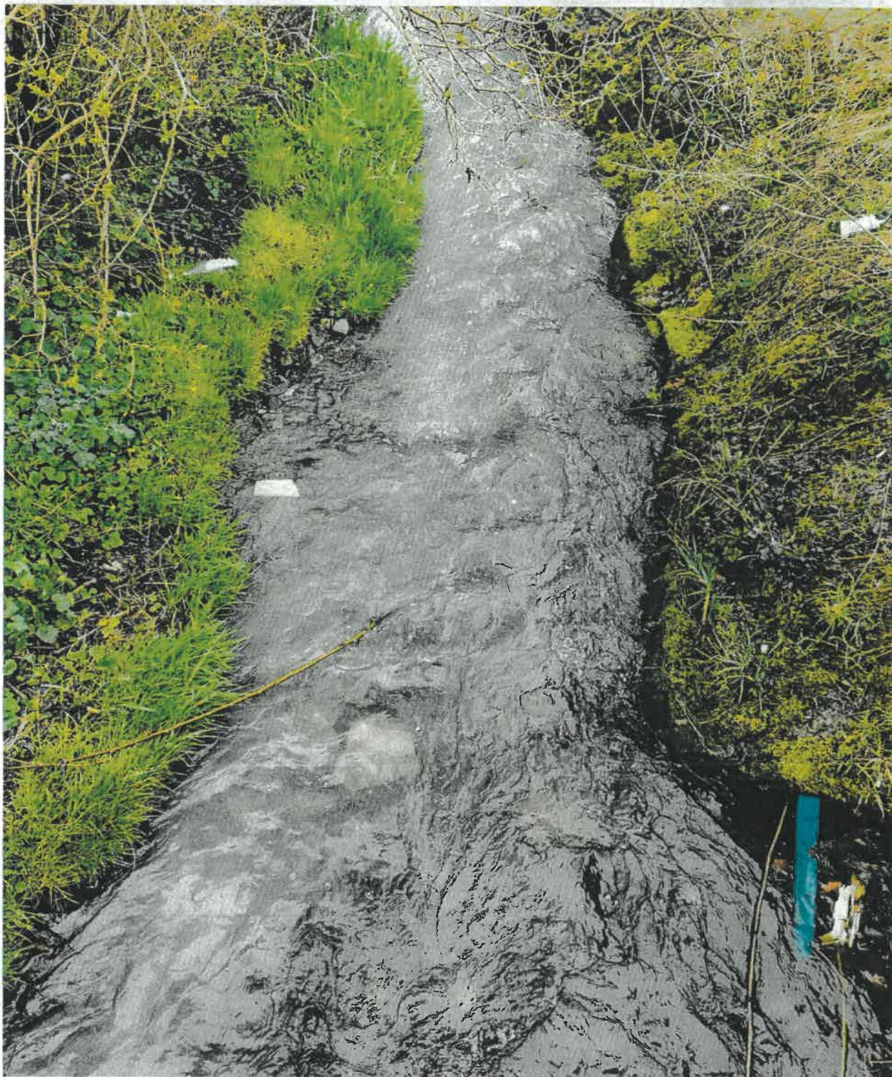
Fot. 4 Wylot do potoku Sienka na wysokości posesji przy ul. Nimasów 33 (posesja naprzeciwko wylotu).

Handwritten signature or initials in blue ink.