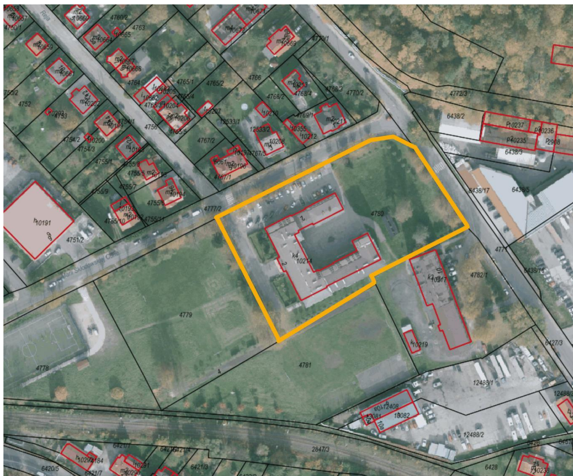
Rysunek 1. Orientacja