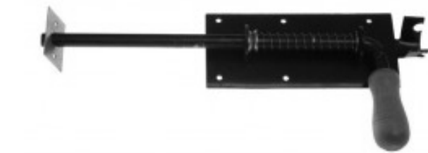
Zasuwa sprężynowa 300 z drewnianą rączką